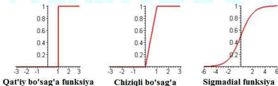
2-rasm Faollashtirish funksiyalari

Faollashtirish funksiyasi – sun‘iy neyronning chiqish signalini (OUT) hisoblovchi nochiziqli funksiya bo‘lib, bu o‘rinda asosan quyidagi funksiyalar ishlatiladi: